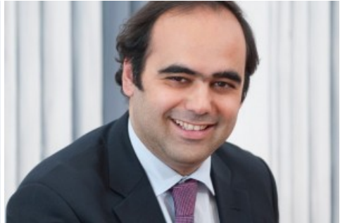
Moçambique – Uma economia com “energia” para crescer

(http://www.oje.pt/angola-diversificar-conquistar/)