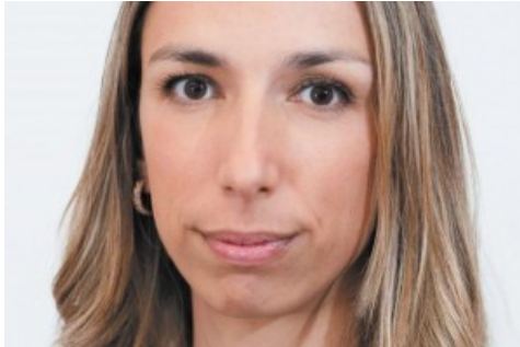
Angola – diversificar para conquistar

(http://www.oje.pt/angola-diversificar-conquistar/)