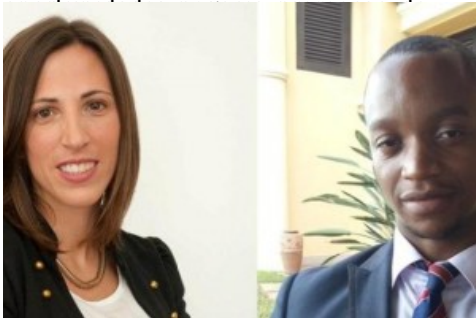
MC&A reforça em Lisboa e Moçambique

(http://www.oje.pt/mocambique-economia-energia-crescer/)