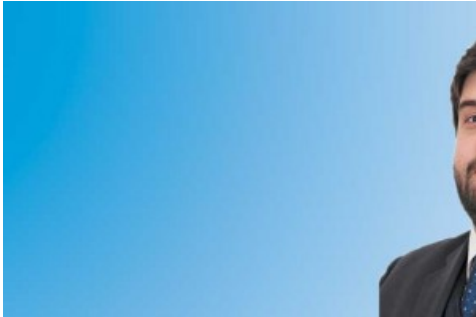
Moçambique. Oportunidades de negócio